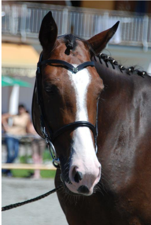
Siegerstute 2008 - Annabell v. Arpeggio