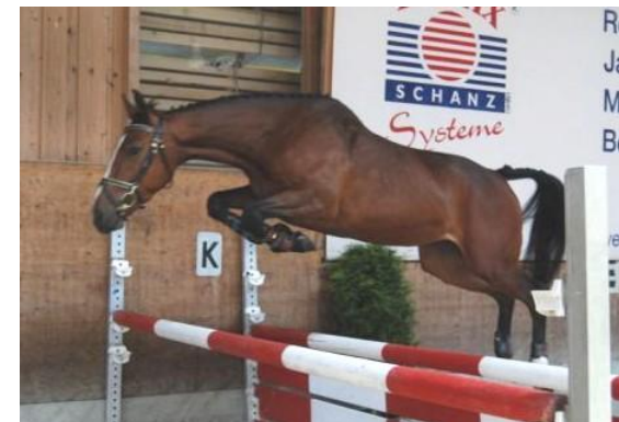
La Leyenda pequeña mit der höchsten Techniknote

Unser alljährliches Team bei Veranstaltungen!!